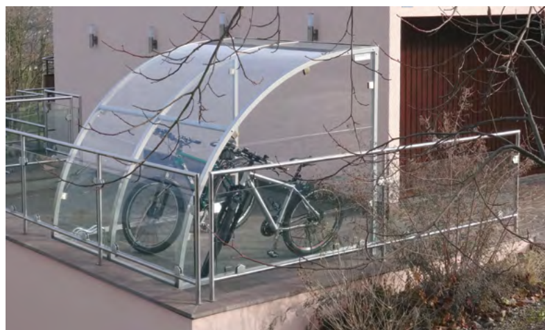
Type 200 cm, avec parois latérales à gauche et à droite, avec revêtement en poudre

Il pourra évidemment aussi être implanté en plaine. Grâce à ses pieds télescopiques, il peut être facilement nivelé. Grâce aux éléments complémentaires pour 4 à 7 vélos supplémentaires, il est possible d’obtenir une belle installation pour les immeubles collectifs ou les lotissements de grande taille.