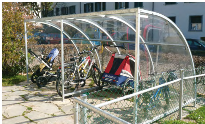
Type 200 cm, une partie complémentaire, parois latérales à gauche et à droite

” L’abri extra solide. L’abri à vélos Engadin est un modèle aux contours arrondis. Il supporte le poids de la neige et est idéal pour une région montagneuse.