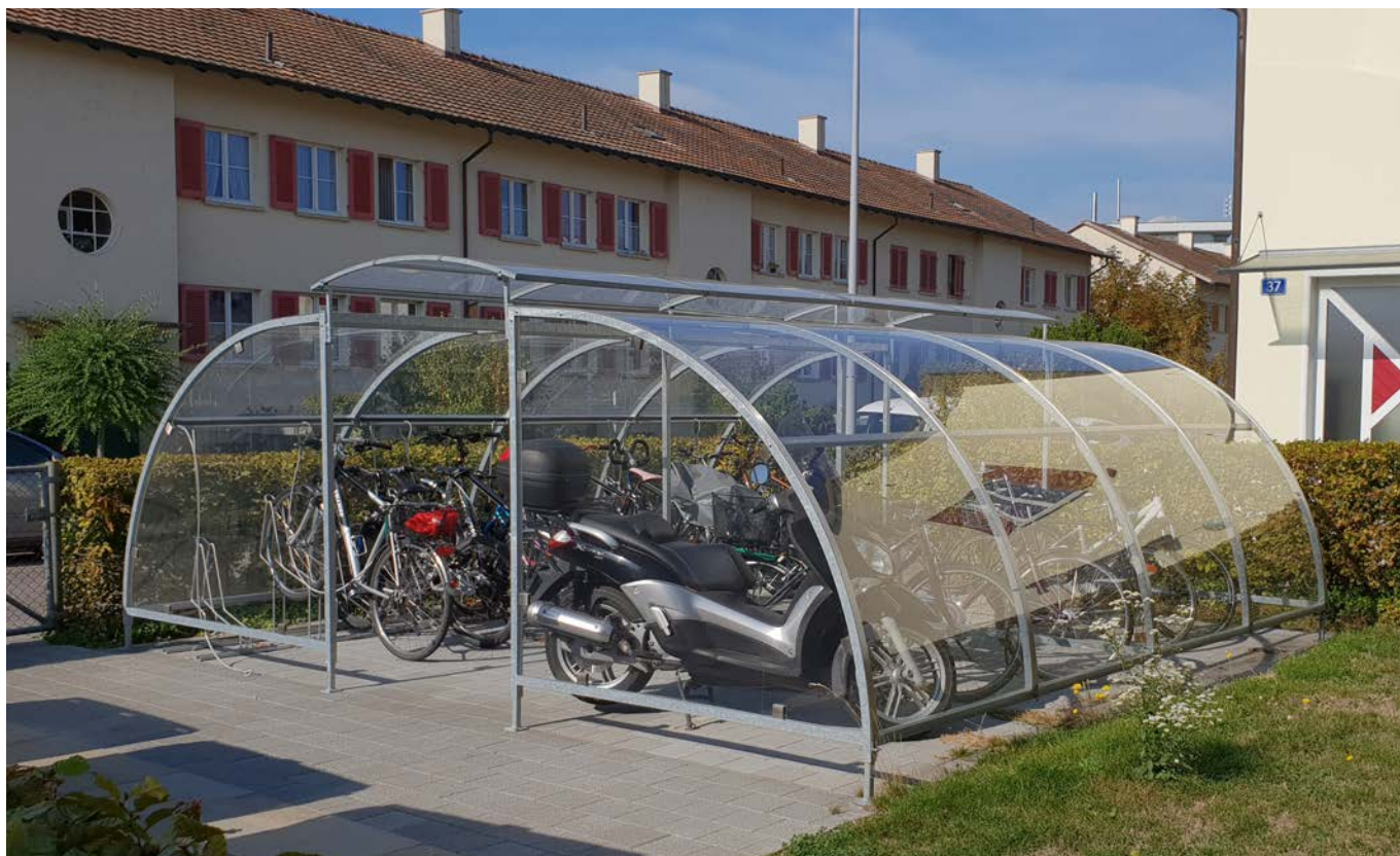
Prix du modèle photographié: CHF 15'360.- (Double-Engadin 500 cm avec toit oblique, parois latérales pour totale 15 vélos et 3 scooters)