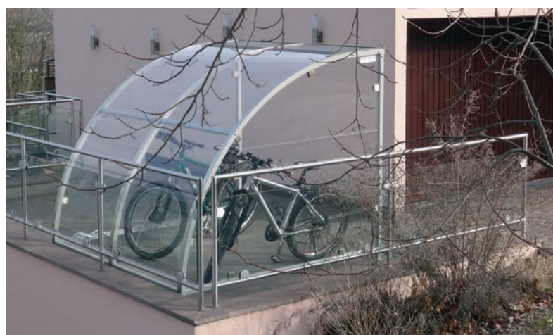
Prix du modèle photographié: CHF 3'960.- (Type 200 cm, avec parois latérales à gauche et à droite, avec revêtement en poudre)