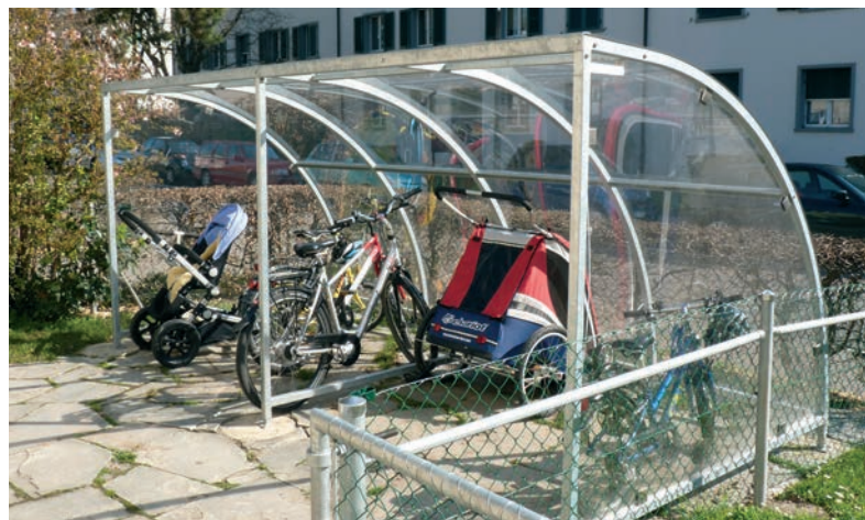
Prix du modèle photographié: CHF 5'650.- (Type 200 cm, une partie complémentaire, parois latérales à gauche et à droite)

” L’abri extra solide. L’abri à vélos Engadin est un modèle aux contours arrondis. Il supporte le poids de la neige et est idéal pour une région montagneuse.