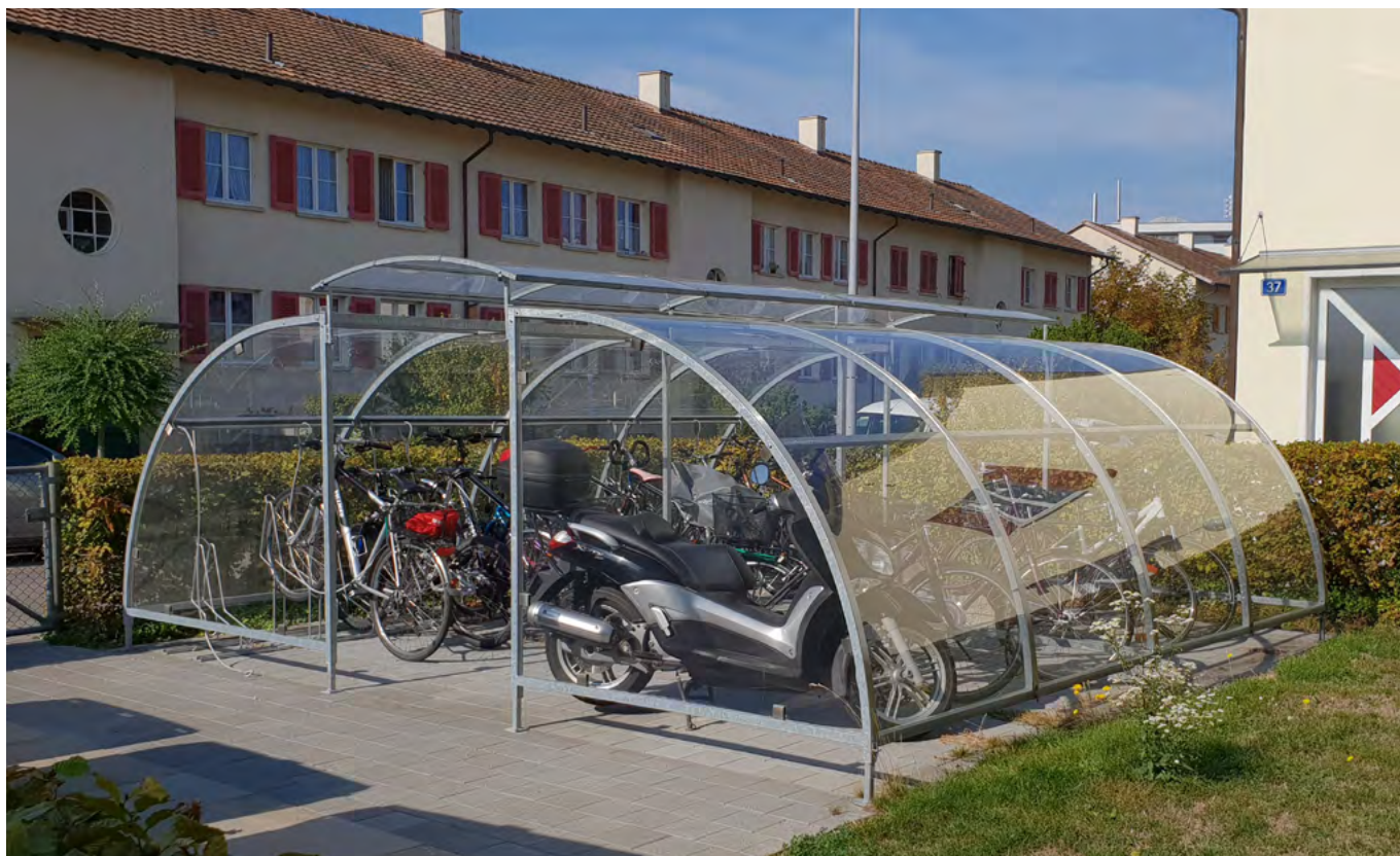
Double-Engadin 500 cm avec toit oblique, parois latérales pour totale 15 vélos et 3 scooters