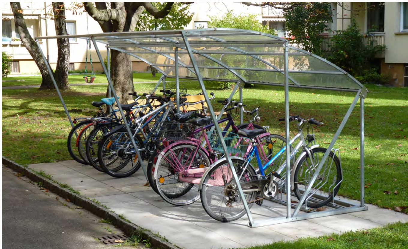
Prix du modèle photographié: CHF 4'860.- (type 250 cm, avec un élément supplémentaire type 250 cm et 10 supports à vélos)