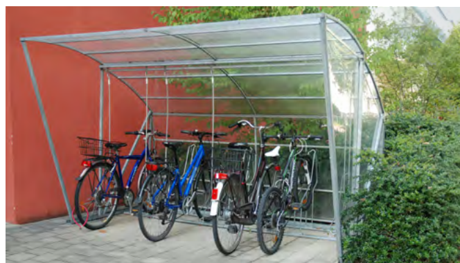
Prix du modèle photographié: CHF 4'695.- (type 300 cm, une paroi latérale, paroi arrière, 7 supports à vélos, console avec câbles d'acier suspendu)

” Beaucoup d'espace de rangement. Le BigRoof offre beaucoup de place (même pour un scooter ou une moto). Il est plus grand et massif que le BikeRoof.