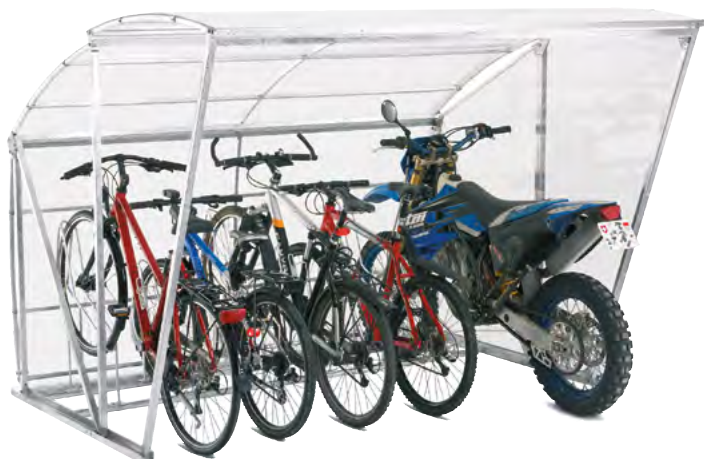
Prix du modèle photographié: CHF 3'870.- (type 250 cm, une paroi latérale, paroi arrière, 5 supports à vélos)

Grâce à sa largeur de 250 cm il peut contenir jusqu'à 5 vélos. Pour un espace encore plus grand, nous vous proposons d'installer un ou plusieurs éléments complémentaires. Grâce à sa hauteur de 187 cm, il est facilement accessible pour des grandes personnes. Le choix entre le BikeRoof et le BigRoof dépend tout d'abord de l'emplacement.