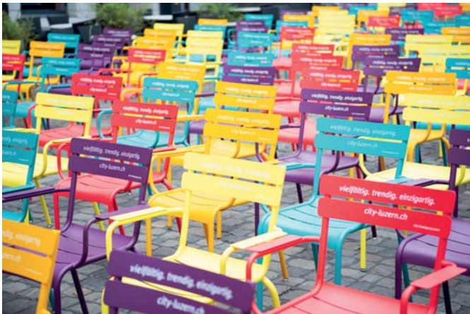
Anwendungsbeispiel im öffentlichen Raum, City Vereinigung Luzern