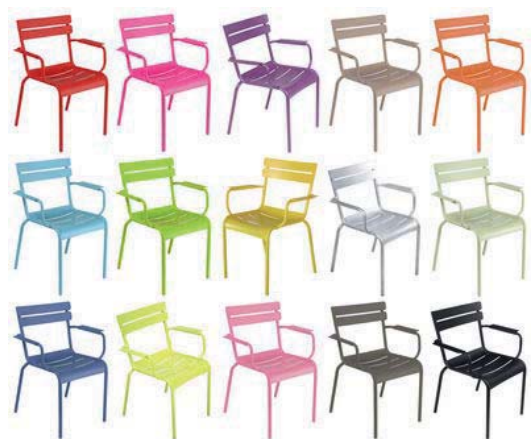
Breite Farbpalette in trendigen Farben verfügbar. Sonderfarben, Brandschutzbehandlung und weitere Optionen auf Anfrage