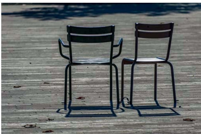
Luxembourg Stühle mit und ohne Armlehne, durch Drahtseilbefestigung gegen Diebstahl gesichert