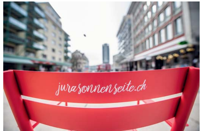
Verpassen Sie Ihren Stadtmöbeln eine eigene Identität durch einen individuellen Aufdruck