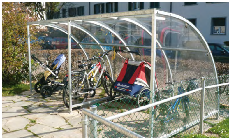
Typ 200 cm, mit einem Anbauelement 200 cm und je einer Seitenwand links und rechts

” Der extra massive Velounterstand. Der Velounterstand Engadin ist klassisch mit Rundbogen aufgebaut. Er hält grossen Schneelasten stand und ist für höher gelegene Standorte empfohlen.