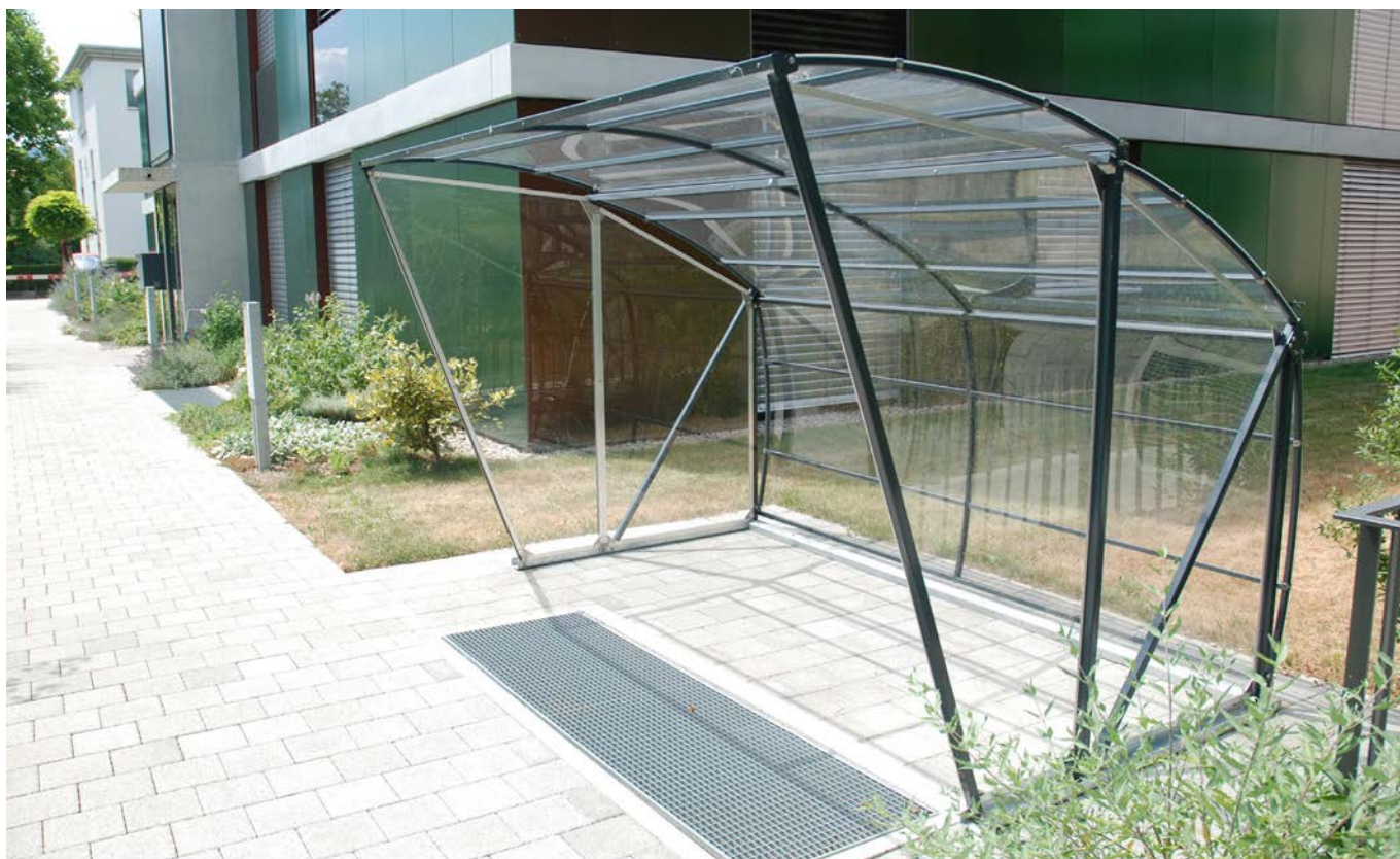
Preis wie abgebildet: CHF 4'960.- (Typ 300 cm, mit Rück- und Seitenwänden links und rechts, pulverbeschichtet in RAL 7016)