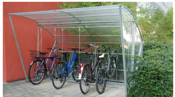
Preis wie abgebildet: CHF 4'695.- (Typ 300 cm mit einer Seiten- und Rückwand sowie 7 Veloständern und 6 Lianen)

„ Viel Platz und Ordnung. Das BigRoof bietet viel Raum (auch für Roller oder Motorräder). Es ist grösser und massiver als sein kleiner Bruder, das BikeRoof.