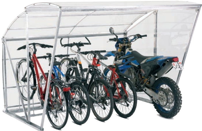
Preis wie abgebildet: CHF 3'870.- (Typ 250 cm mit einer Seiten- und Rückwand sowie 5 Veloständern)

Mit einer Breite von 250 cm bietet es bereits Platz für fünf Velos. Für grössere Anlagen bieten wir Anbauelemente an. Mit einer Höhe von 187 cm kommen auch grössere Personen bequem an ihr Zweirad. Ob Sie sich für ein BigRoof oder ein BikeRoof entscheiden, hängt vor allem von der Raumsituation Ihres Eigenheims ab.