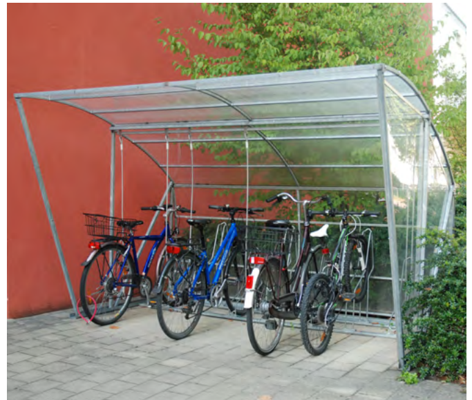
(Typ 300 cm mit einer Seiten- und Rückwand sowie 6 Veloständern und 6 Lianen)

Mit einer Breite von 250 cm bietet es bereits Platz für fünf Velos. Für grössere Anlagen bieten wir Anbauelemente an. Mit einer Höhe von 187 cm kommen auch grössere Personen bequem an ihr Zweirad. Ob Sie sich für ein BigRoof oder ein BikeRoof entscheiden, hängt vor allem von der Raumsituation Ihres Eigenheims ab.