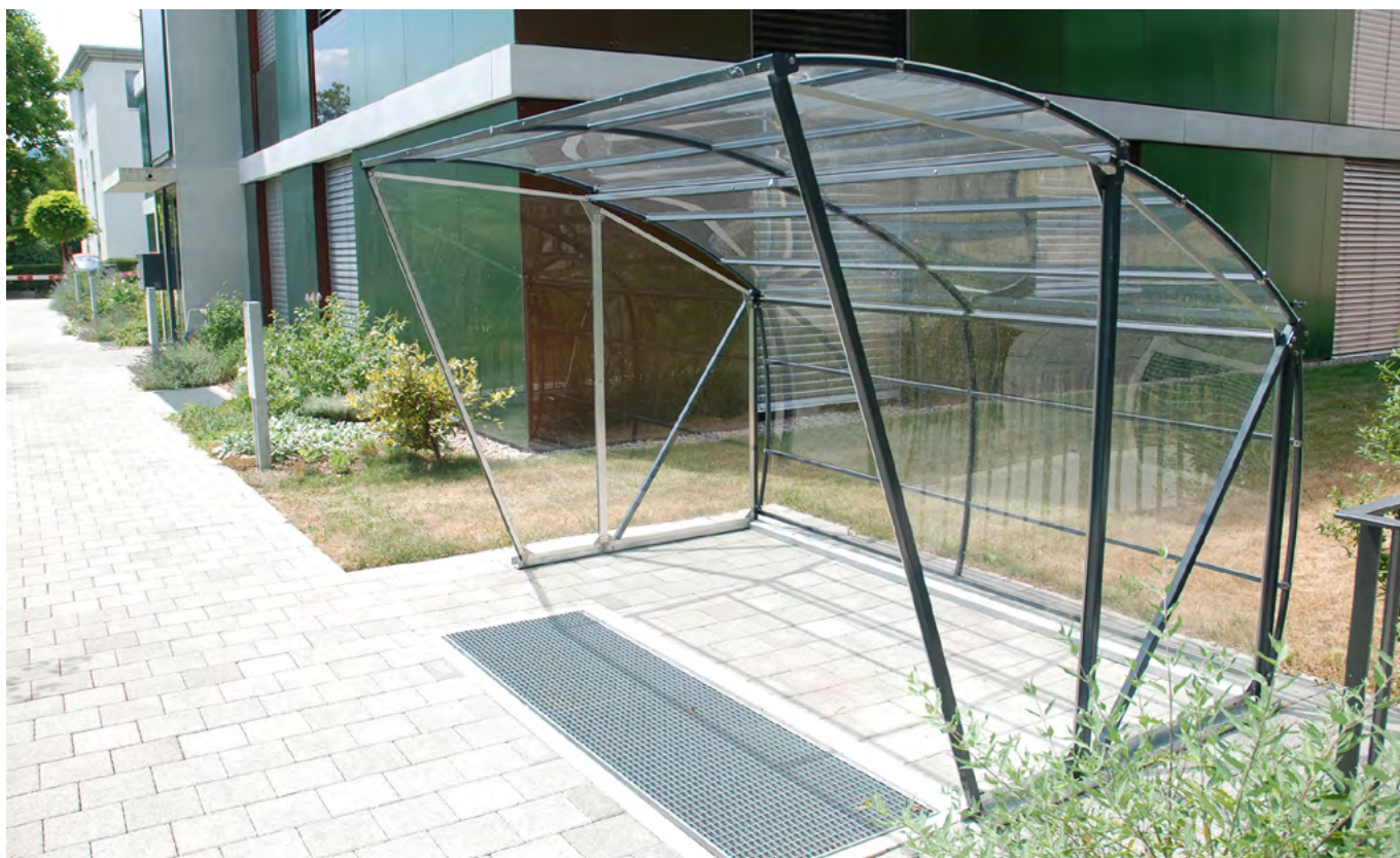
(Typ 300 cm, mit Rück- und Seitenwänden links und rechts, pulverbeschichtet in RAL 7016)